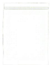
チャック付ポリ袋