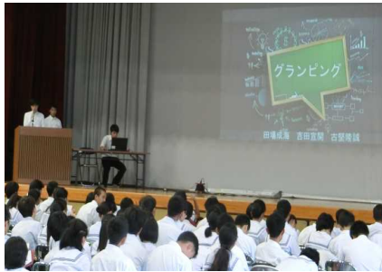
【プロジェクト発表の様子】