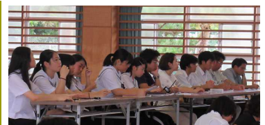
【真剣な表情の審査委員・係】