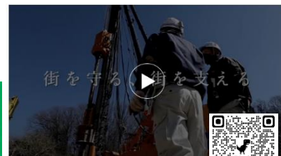
高校新卒者向け採用ムービー