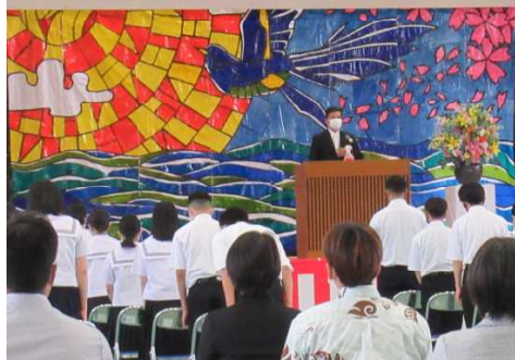
第76回久米島高等学校入学式